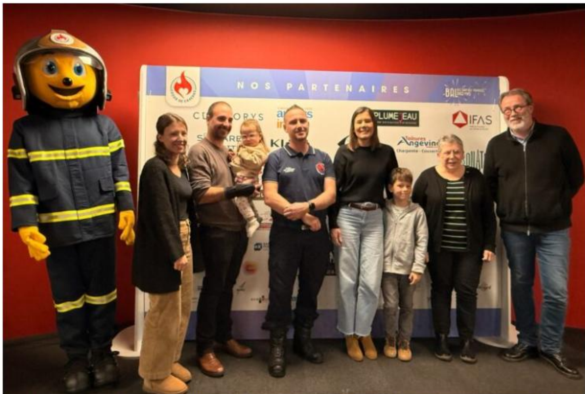
Les bénéficiaires des bénéfices du Bal des Pompiers Angevins.

Une réussite populaire totale, fruit d'un travail en étroite collaboration avec les élus et les services de l'État.