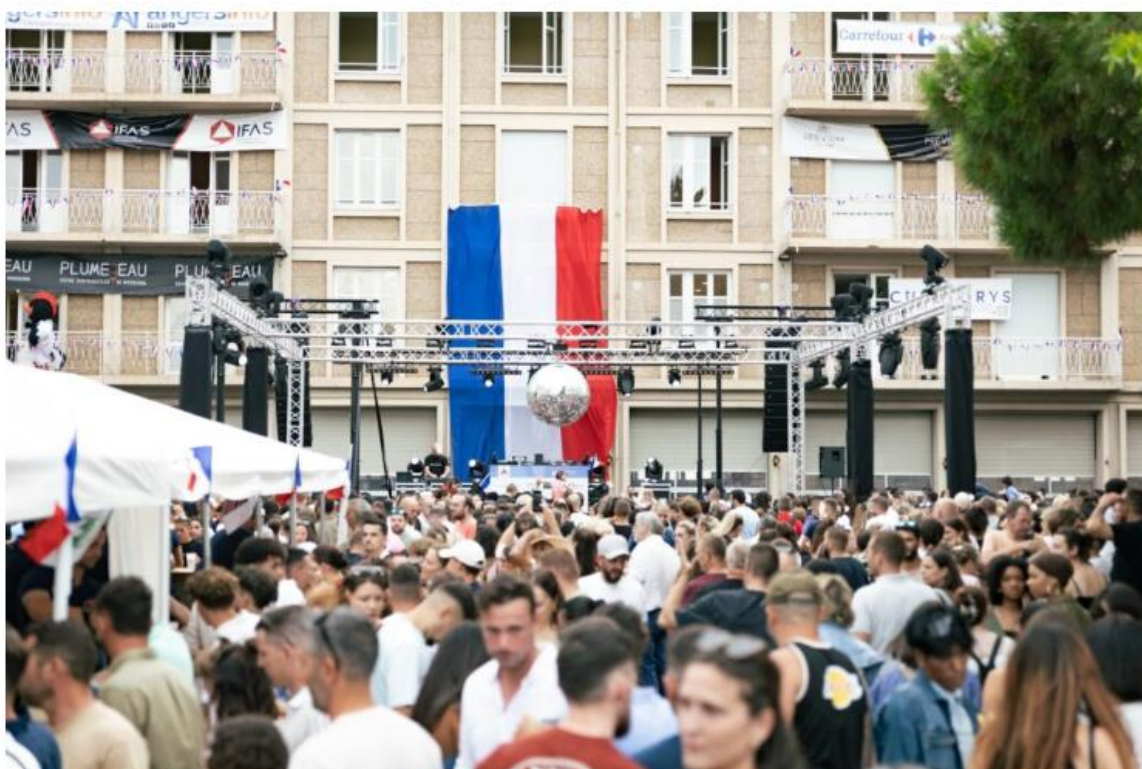
Le Bal des Pompiers Angevins du 13 juillet 2025 à la Caserne de l'Académie à Angers.

Il y a des idées qui naissent autour d'un café et qui finissent par déplacer des montagnes. Ce premier Bal des Pompiers Angevins est de celles-là. Mais il est important de le rappeler : ce n'était pas seulement l'événement d'un lieu, mais l'union sacrée des trois casernes angevines : Le Chêne Vert, Angers Ouest et Académie.