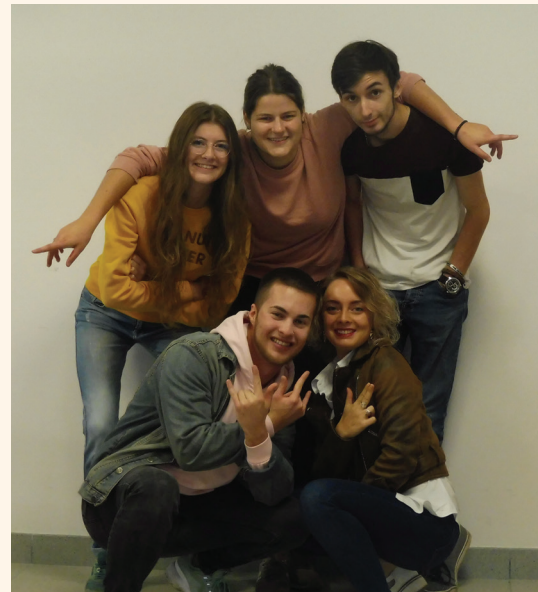
Tout l'équipe VSC au grand complet !