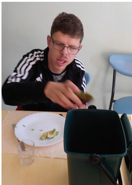
Jordan qui jette la peau de l'avocat dans la poubelle pour le compost

Prochaine étape : installer des poubelles sur les