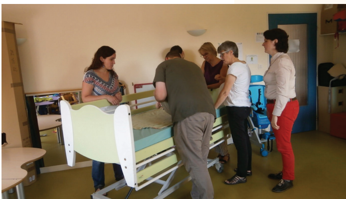
Mise en situation de parents et de professionnels