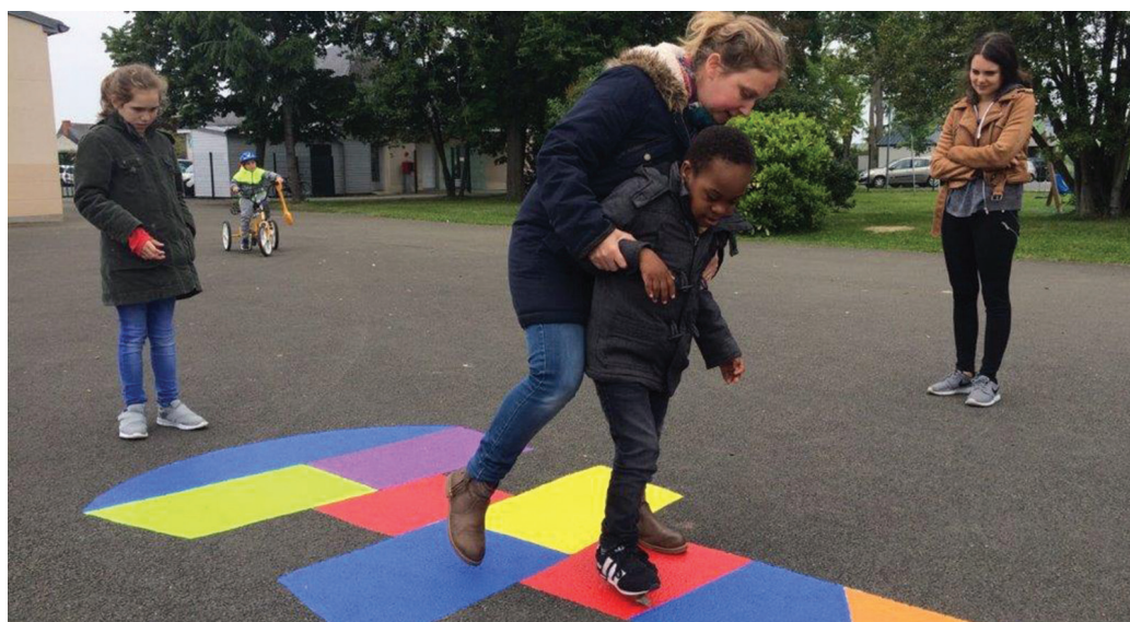
Les enfants de l'IME se sont très vite appropriés les couleurs et les jeux de la cour !