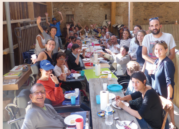
La Mésangerie en fête à l'équi-terre-happy !