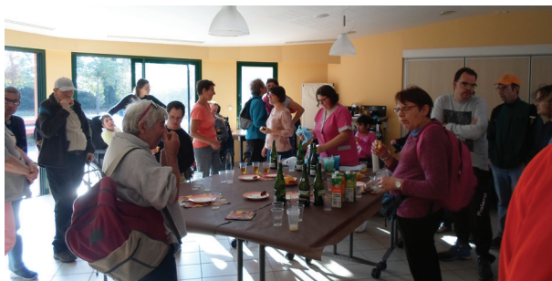
Goûter à la Palomberie avec les randonneurs

les participants se sont retrouvés autour d'un goûter à La Palomberie. Les résidents étaient ravis de faire découvrir aux marcheurs d'autres structures médico-sociales, aux bénévoles et aux élus locaux, leur lieu de vie.