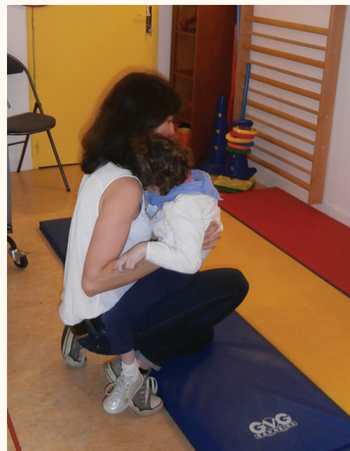
Rose et sa maman