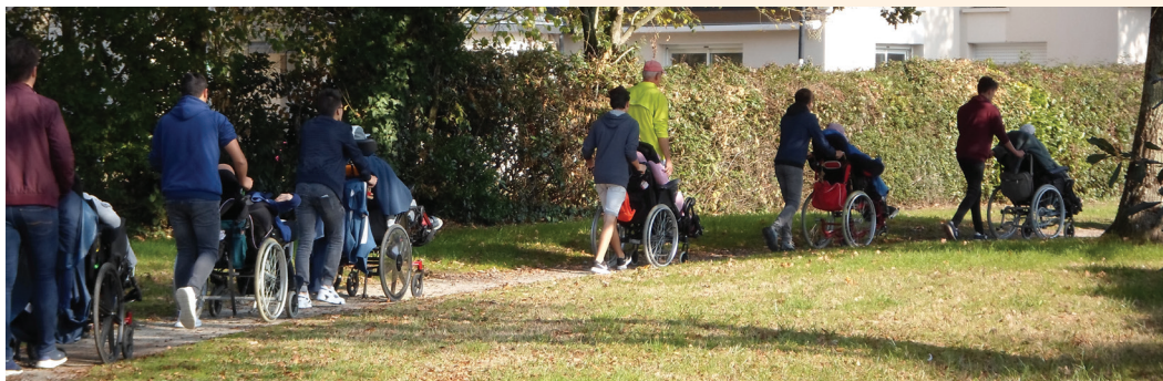
Les résidents et les jeunes bénévoles lors de la rando

A 14h30, samedi 20 octobre, une cinquantaine de randonneurs sont partis de la MAS de la Palomberie pour profiter des sentiers de verdure de Saint Sylvain d'Anjou. Neuf résidents de la Palomberie ont effectué un parcours de 4 kms. Ils furent accompagnés par six jeunes bénévoles de Saint Sylvain d'Anjou dans le cadre d'un Projet Jeunes Solidaires. Des bénévoles du club de l'Espérance, des Millepattes et des organisateurs de la semaine (CCAS...) encadraient également le parcours. Après cette belle balade, tous