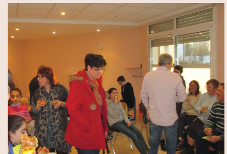
Discussions autour de la galette