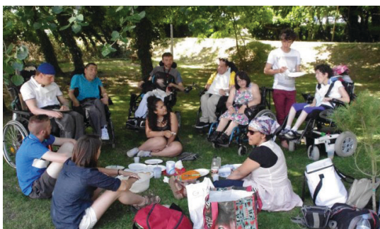
Séjour dans la Sarthe