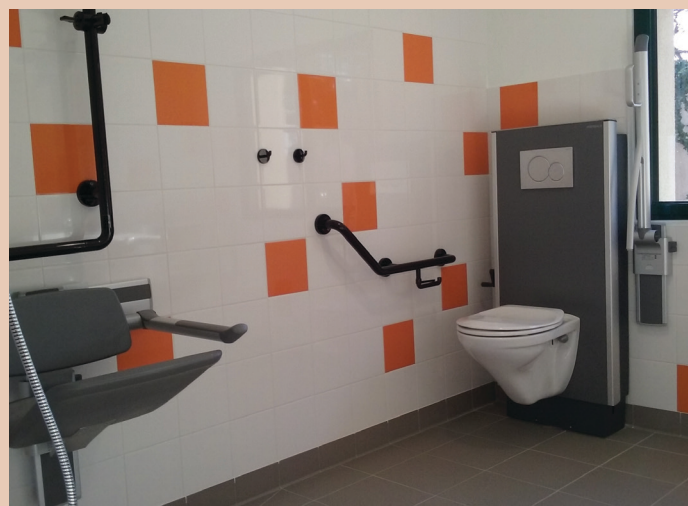
Douche et toilettes adaptables