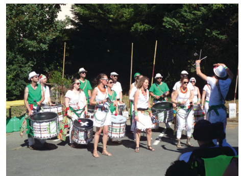
Fin de l'AG HandiCap'Anjou tout en couleurs et musique avec la fanfare Los Percutos