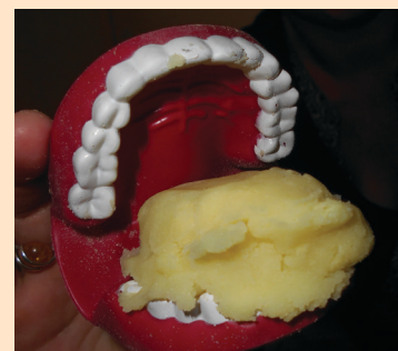
Bouche, notre marionnette