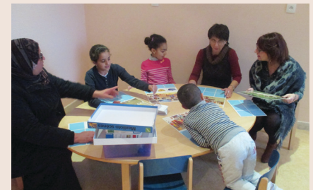
Des amateurs de Maxiloto