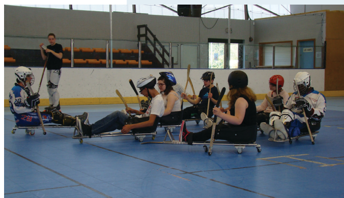
Les collégiens et les joueurs du club