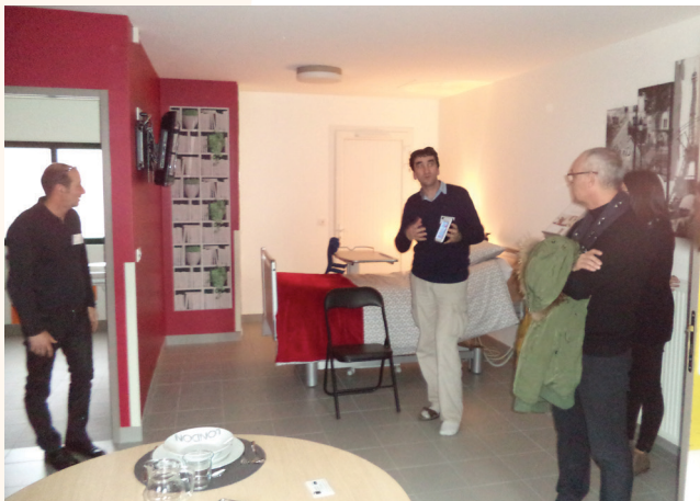
Visite guidée et commentée par l'équipe du bureau DOMEVA