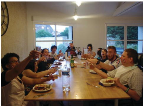
Soirée foot : Allez les Bleus !!

Si vous avez envie de donner de votre temps et venir rejoindre notre équipe, contactez-nous avant le mois de décembre !