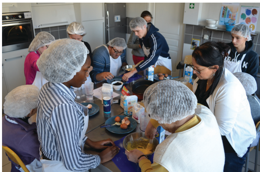
Le groupe des pâtissiers dans l'atelier cuisine professionnelle de l'IME