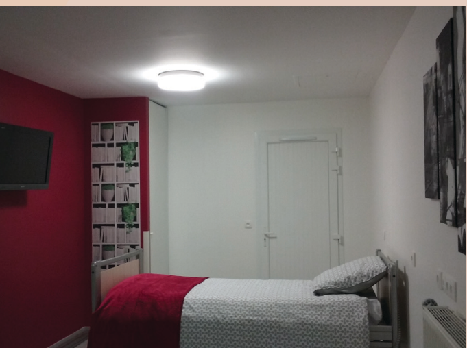
Chambre avec lit médicalisé

« J'ai aujourd'hui l'honneur et le plaisir de vous souhaiter ce jour la bienvenue à l'inauguration du Studio Tremplin que vous pourrez bientôt découvrir.