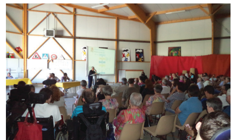
Assemblée Générale HandiCap'Anjou

Juin fut l'occasion pour celles et ceux qui ne connaissaient pas encore le PVS d'en faire la découverte lors de l'Assemblée Générale qui s'est tenue le 10 juin dans ses locaux. La séance s'est clôturée dans la convivialité autour d'un cocktail, accompagné par la fanfare Los Percutos.