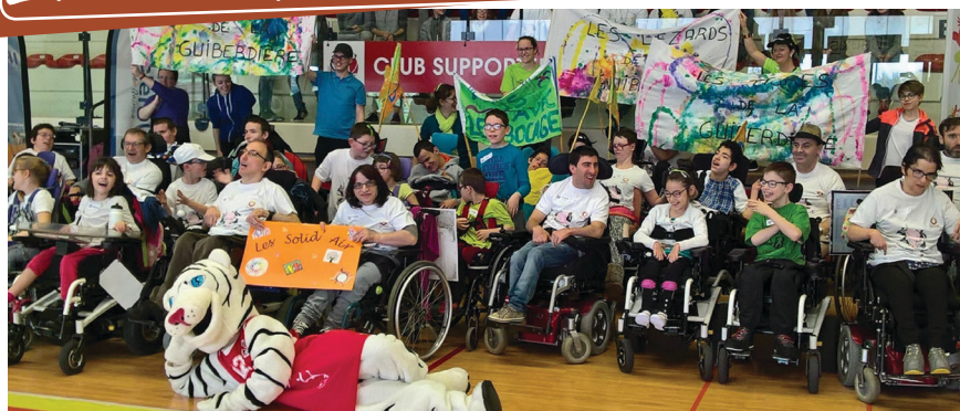
Les adolescents et les adultes des établissements HandiCap'Anjou réunis pour la compétition !

Judi 30 mars, nous étions à la journée départementale d'Handisport inter-établissements, à Brissac.