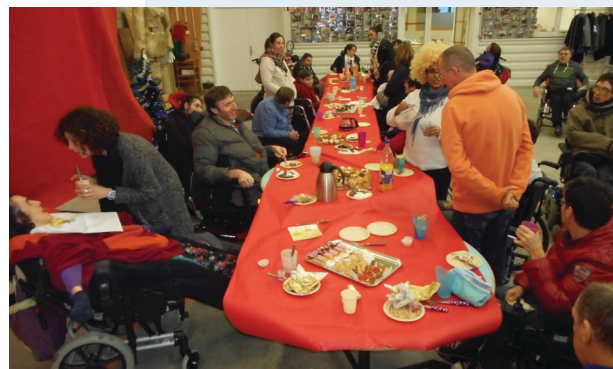
Ensemble pour l'année 2017 !