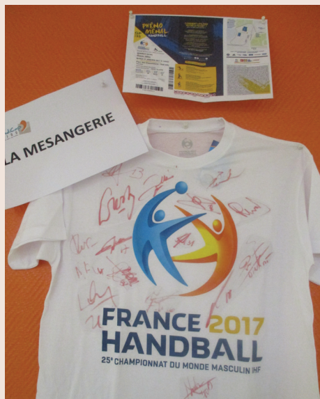
Maillot officiel de l'équipe de France de Handball dédié !