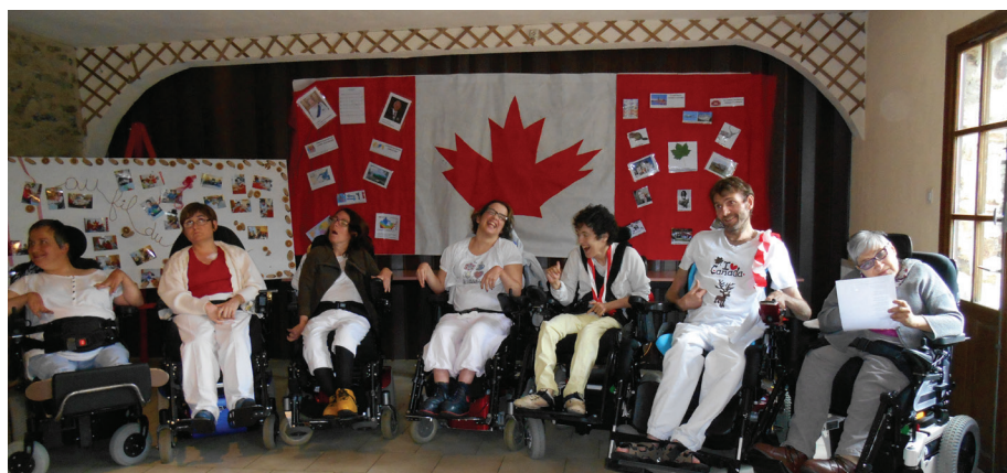
Les résidents aux couleurs du Canada