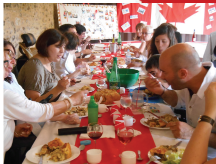
Le repas canadien