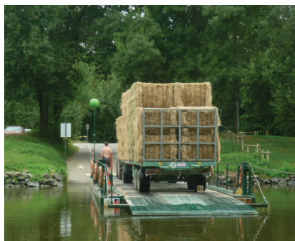
A l'île Saint Aubin

Galerie sonore : La galerie s'est déplacée à l'IME. « On a découvert des instruments du monde entier, comme le luth ».