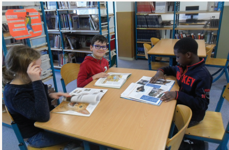
Nos trois collégiens à la BCD