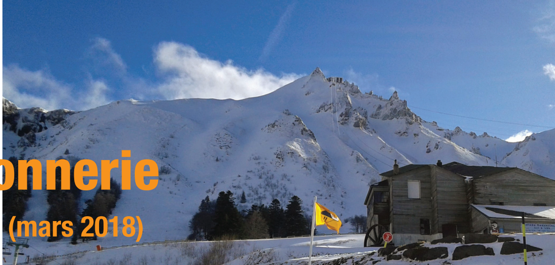
Le massif du Sancy