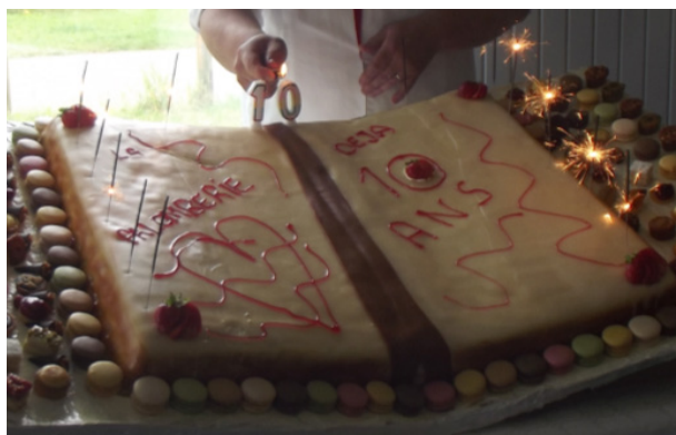
Une nouvelle page, toute en gourmandise, se tourne...