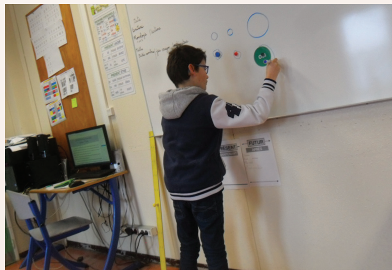
Allez hop, au tableau !