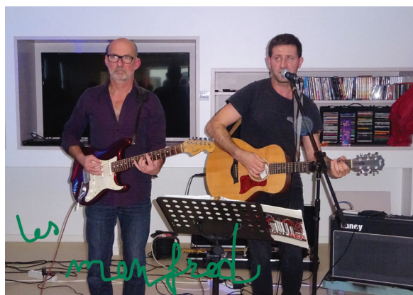
Le groupe MANFRED

Pour fêter la fin des travaux (passerelle reliant Bocage et l'internat Tournesols), tous les jeunes et professionnels ont pu profiter d'une ambiance festive. Le groupe Manfred nous a proposé un concert « dynamite » ! Oscillant entre composition rock, blues ou ballade folk, «Manfred» vous propose une musique sincère, instantanée et explosive ! Les jeunes ont chanté à tue-tête !