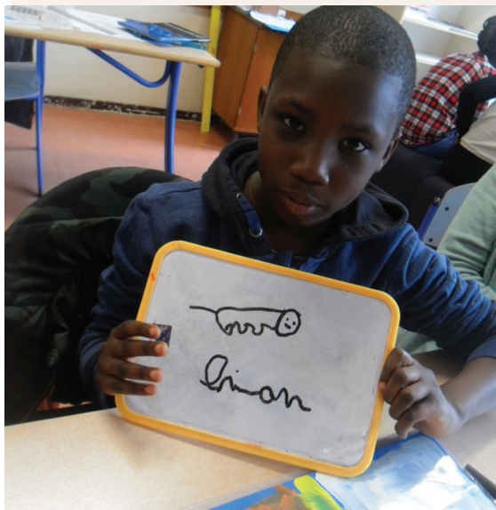
Au collège, pour rugir de plaisir...