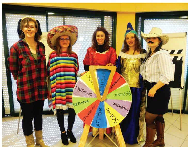
L'équipe des VSC (volontaires du service civique) au grand complet !