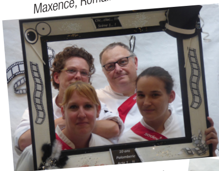
L'équipe cuisine de la Palomberie