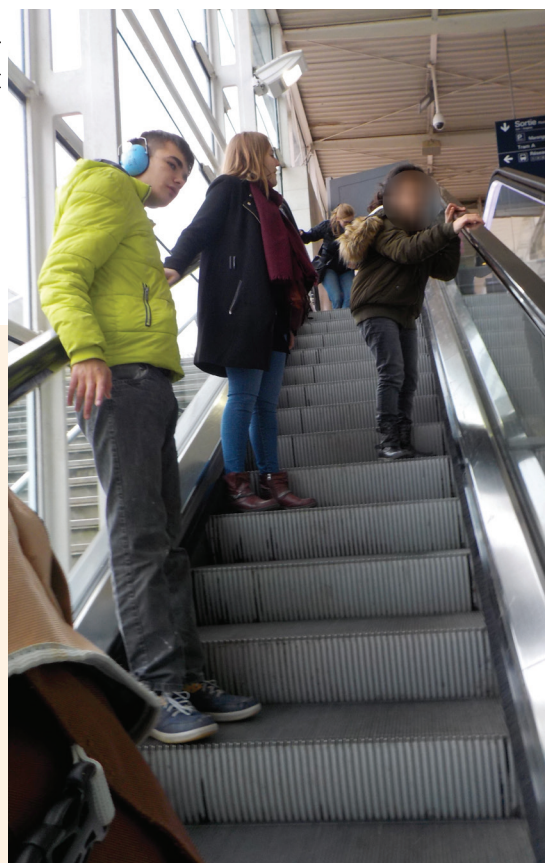
Descente des escalators de la gare d'Angers