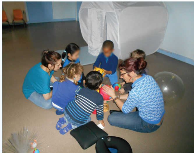
Les enfants de l'école Montesquieu découvrent les objets sensoriels utilisés par l'équipe de l'UEMa

* Unité d'Enseignement Maternelle : classe de 7 enfants atteints de troubles du spectre autistique, gérée par HandiCap'Anjou et située au sein de l'école maternelle.