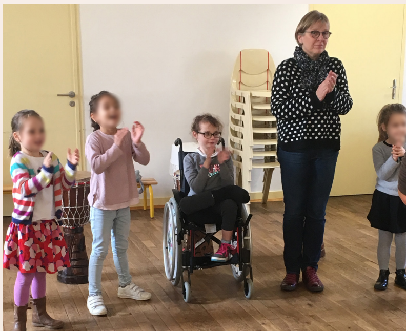
Dans la classe, on chante, on danse ensemble...