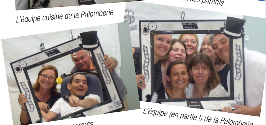
L'équipe (en partie !) de la Palomberie