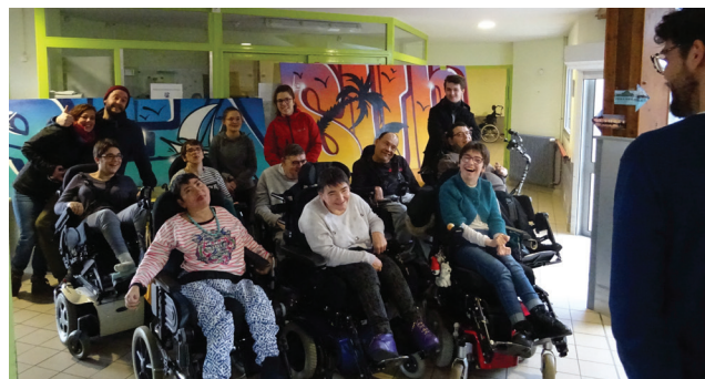
Ci-dessus les 2 fresques « Tahiti » et « Bora Bora » et photo souvenir pour le groupe des artistes !