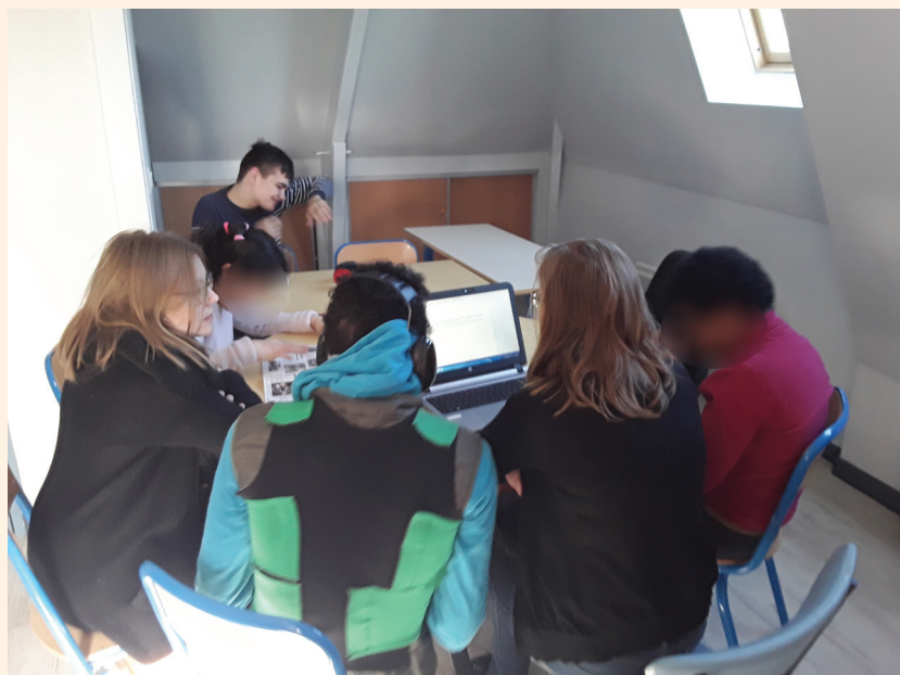
Ecriture de l'article du Trait d'Union