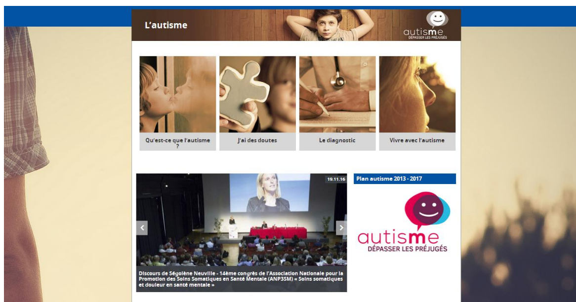
Capture d'écran de l'accueil du site internet www.autisme.gouv.fr

Il aura pour but d'informer le public sur l'autisme et d'améliorer les connaissances générales sur ce handicap.