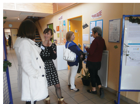
Visite guidée par les salariés du SESSAD