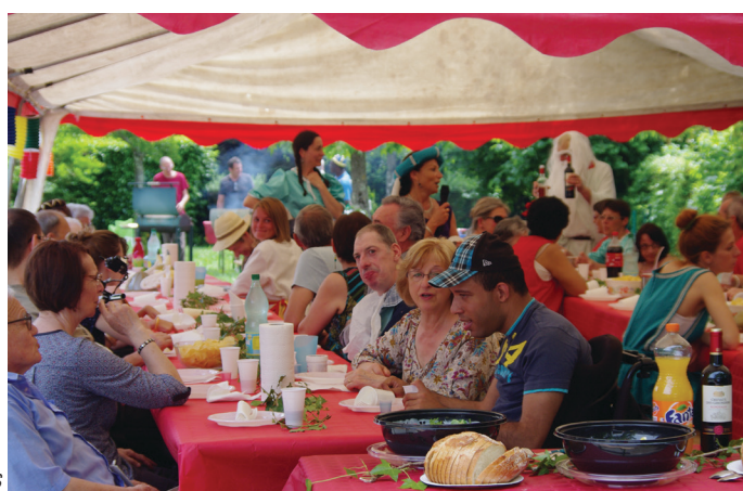
Repas rassemblant les familles et résidents