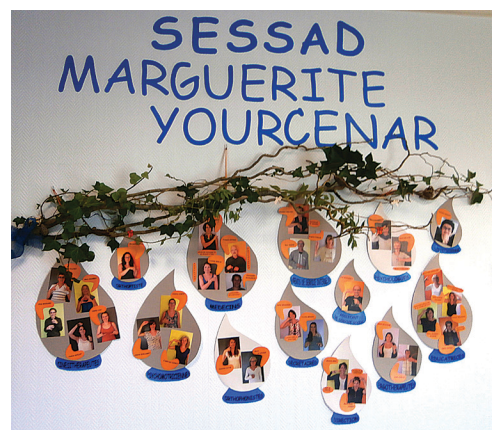
Trombinoscope réalisé par l'équipe du SESSAD