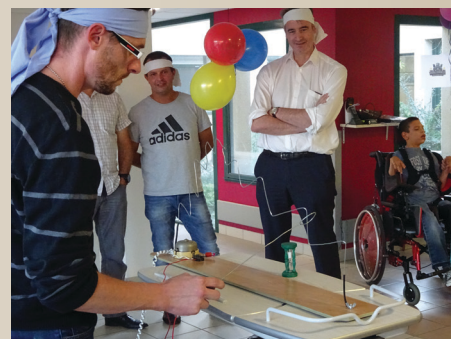
Les papas en pleine compétition