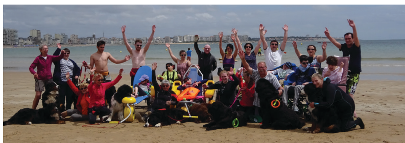
Les jeunes du Bocage, les professionnels, les bénévoles... et les chiens