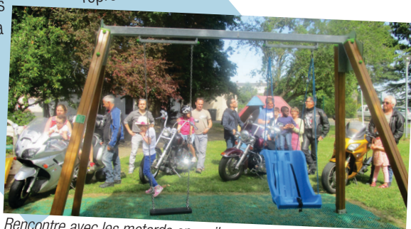
Rencontre avec les motards en avril

Depuis quelques années, le Moto Club SOUDEZEN de Mazé, organise une randonnée à motos au profit des enfants de l'IME. Cette année, ce don a permis d'acheter un nouveau portique et les enfants ont été très impressionnés par ces belles machines lorsque les représentants du Moto Club sont venus pour la photo !