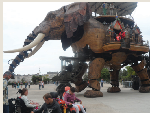
L'éléphant à Nantes