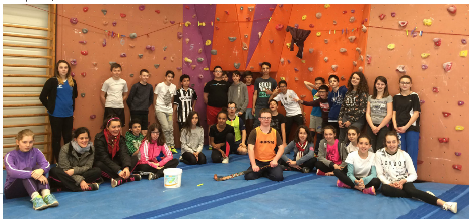
Les jeunes de l'ASAM avec les collégiens de Jean Monnet