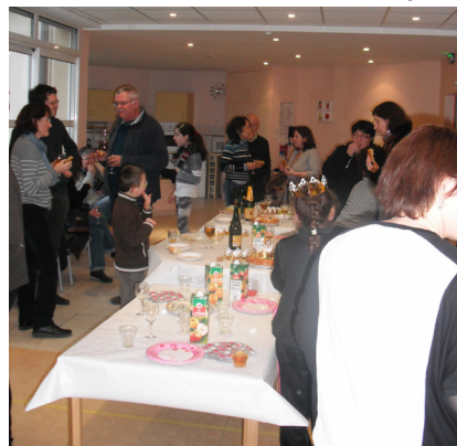
Les familles rassemblées autour de la galette