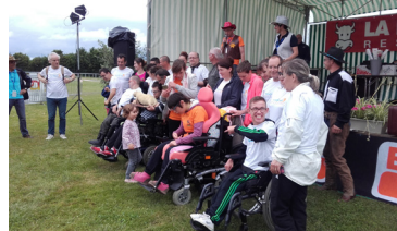
L'ensemble des participants HandiCap'Anjou