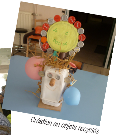
Création en objets recyclés