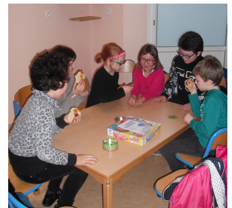
Petite partie de « Dobble » entre enfants