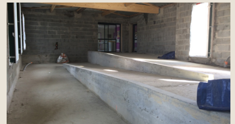
Vue de la future rampe d'accès

Les jeunes et l'équipe du Dispositif Adolescents (EEAP Le Bocage et IEM Les Tournesols)