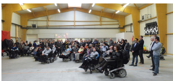
Le jour de l'inauguration du PVS le 20 janvier