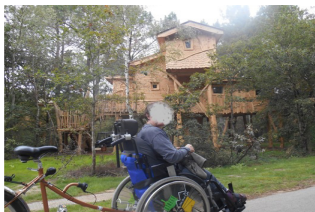
Et c'est parti pour une belle ballade !