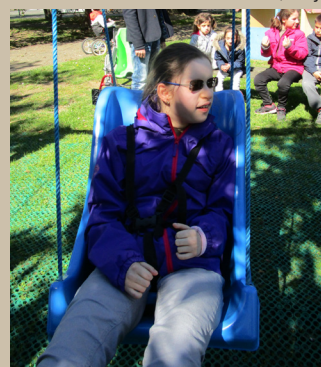
Pauline à la balançoire

ment au Laser-Game en début d'après-midi.