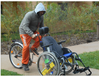
Un essai à vide pour voir si tout fonctionne bien...

Comme nous avons emmené les mono-pousseurs, nous nous sommes promenés à