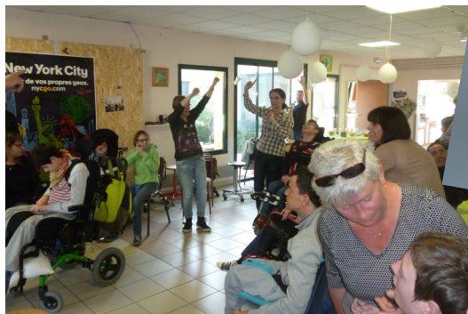
Les jeunes du Bocage et leurs mamans