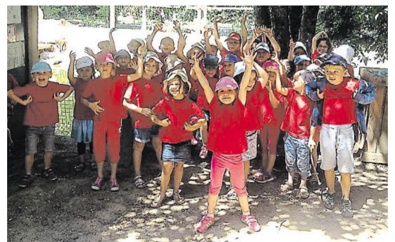
Les vacances approchent et il y a de la joie à l'Accueil de loisirs.

Infos et tarifs au 3, allée du Taillis. 02 41 76 45 56. www.asso3a.fr rubrique « accueil de loisirs ».