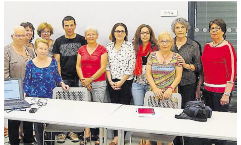
Les membres du bureau de l'association La Passerelle des mots.

l'ouverture de La Passerelle des mots en août dernier. On dénombre 13 comptes « associations » écoles, centre de loisirs et TAP. 3 063 documents sont stockés dans la base informatique (romans, essais, documentaires, albums, BD ; mangas, quelques CD et livres audio. Environ 700 livres sont des dons de particuliers. Le stock est renouvelé régulièrement grâce à Bibliopôle, ce qui offre des nouveautés et le rend donc plus attractif. Enfin, il y a autant d'adultes inscrits que d'enfants. « La bibliothèque est au cœur de la vie culturelle et éducative cantenaysienne », souligne le président. Des projets en partenariat, des rencontres, échanges sont à l'étude.