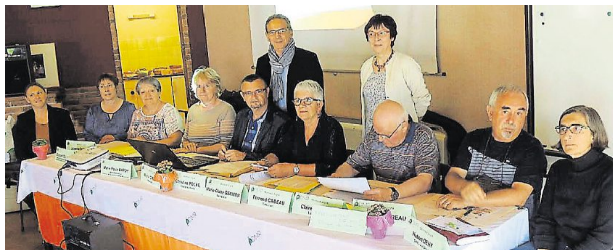
Le bureau de l'Aide à domicile en milieu rural au grand complet lors de l'assemblée générale, vendredi 10 juin.

A compter du 1 er septembre, l'ADMR va mettre en place un service d'interventions de nuit à Montreuil-Juigné.